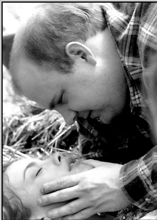
Liv Tyler och Pruitt Taylor Vince